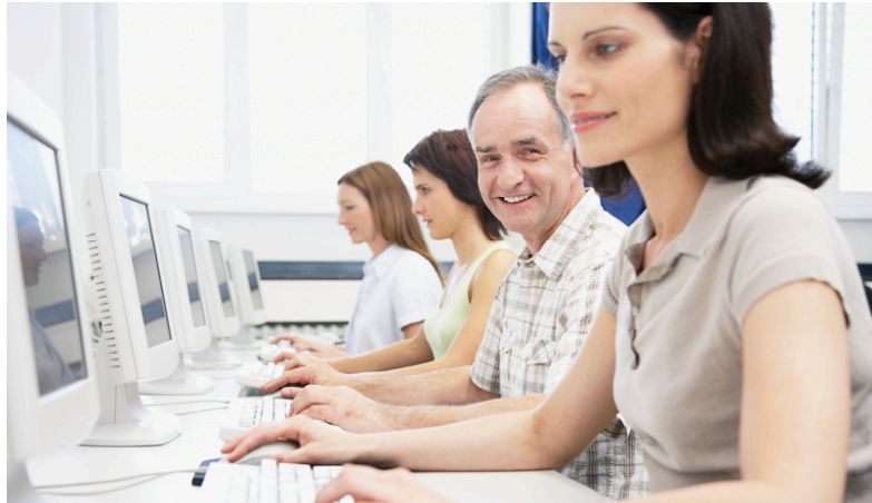
TXEKIN promueve la creación de empresas, preferentemente de base tecnológica y/o innovadora

Este programa del Departamento de Innovación y Sociedad el Conocimiento, enmarcado en el eje 1 del Programa Operativo FEDER del País Vasco 2007-2013, ha apoyado entre 2007 y 2008 la creación de 1.465 nuevas empresas